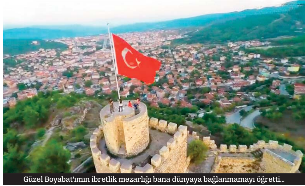
Güzel Boyabat'ımın ibretlik mezarlığı bana dünyaya bağlanmamayı öğretti...