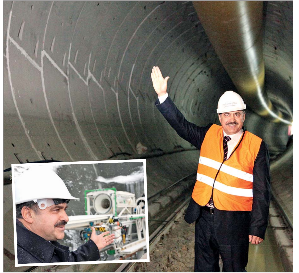
Orman ve Su İşleri Bakanı Veysel Eroğlu, AK Parti'nin 15 yıllık hükümetleri döneminde, en uzun bakanlık yapan isimlerin arasında yer alıyor.